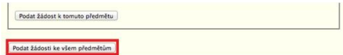
Obr. 7: Finální podání žádostí