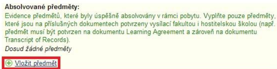
Obr. 2: Vložení absolvovaných předmětů Pozn.