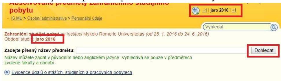
Obr. 3: Dohledání předmětu, kontrola období

Založte předmět přesně dle potvrzení hostitelské školy