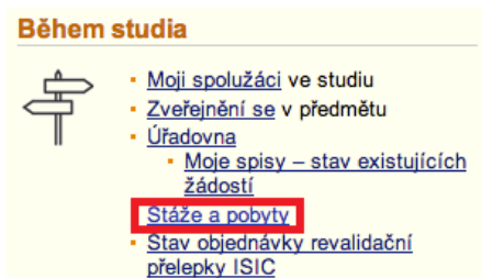
Obr. 1: Aplikace pro evidenci stáží a pobytů