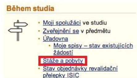
Obr. 1: Aplikace pro evidenci stáží a pobytů